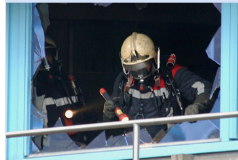
Brand VU Medisch Centrum